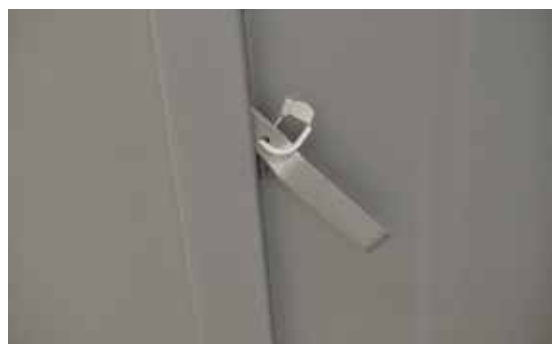
Photo n° 5 Plombage de l'armoire de transport.