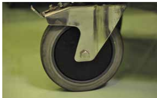
Photo n° 4 Roue de l'armoire de transport (réf : Tiziano Balmelli).